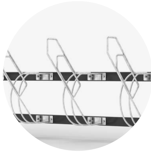
Ramlås Rambo monterad på cykelställ Bike