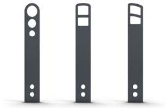
Cykelpollare Orion, Calypso och Delta