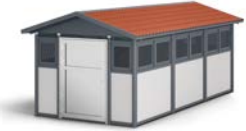
Alpha, höjd 2877 mm