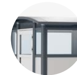
Härdat glas i vägg