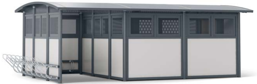
Cykelförråd Tellus går att utforma på flera olika sätt, även med hjulhållare och ramlås på ytterväggen.